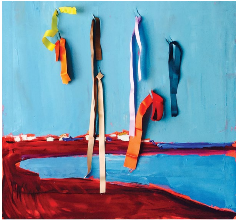
120x120 см. Полотно, олія 120x120 cm. Oil on canvas