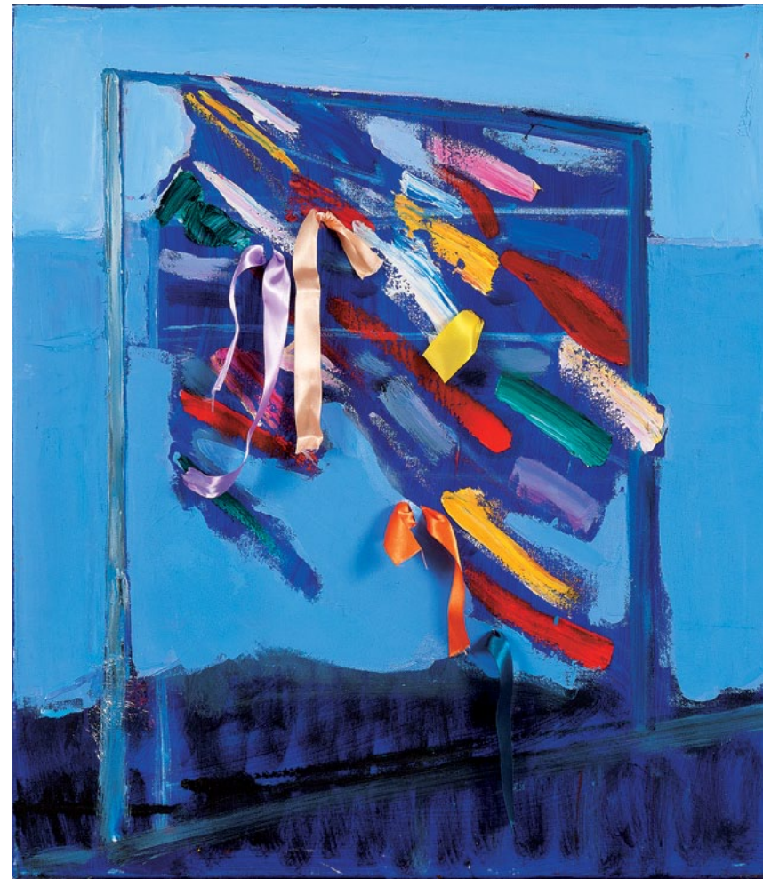
80x100 см. Полотно, олія 80x100 cm. Oil on canvas