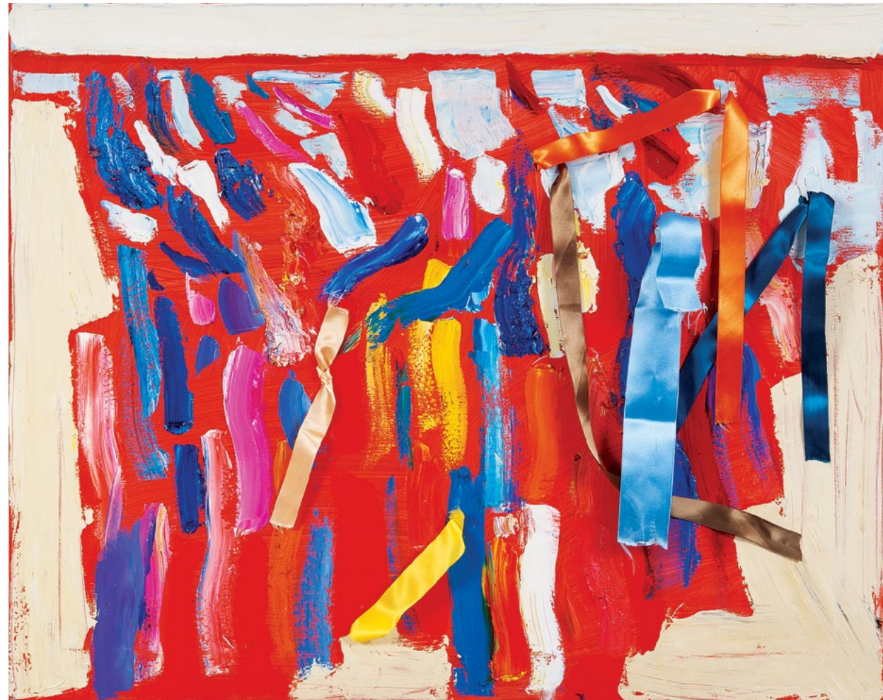
80x60 см. Полотно, олія 80x60 cm. Oil on canvas