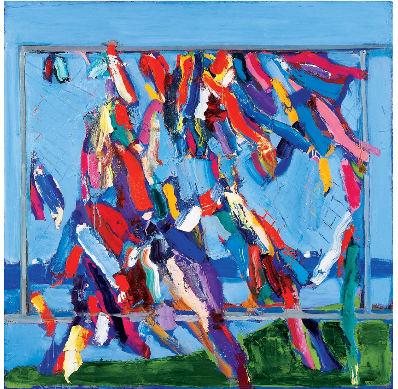
150x150 см. Полотно, олія 150x150 cm. Oil on canvas