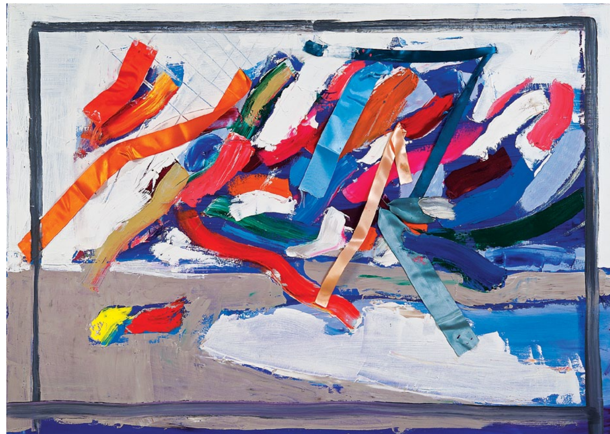
100x140 см. Полотно, олія 100x140 cm. Oil on canvas