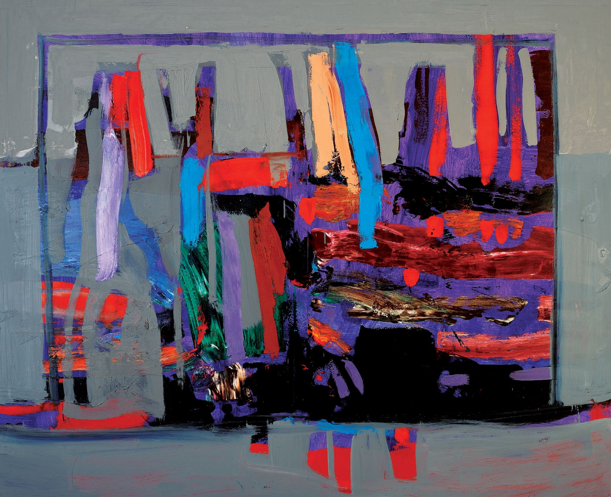
180x200 см. Полотно, олія 180x200 cm. Oil on canvas