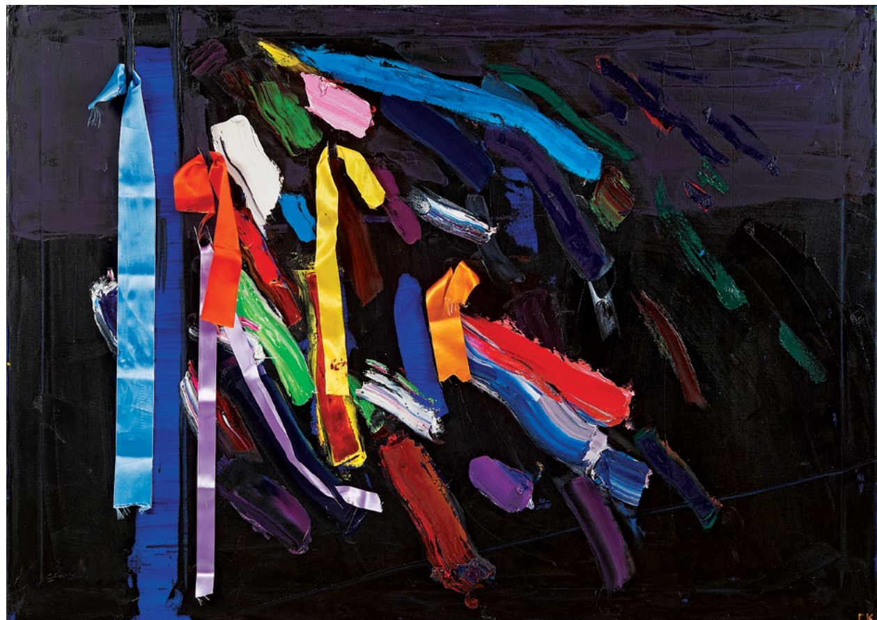
100x140 см. Полотно, олія 100x140 cm. Oil on canvas