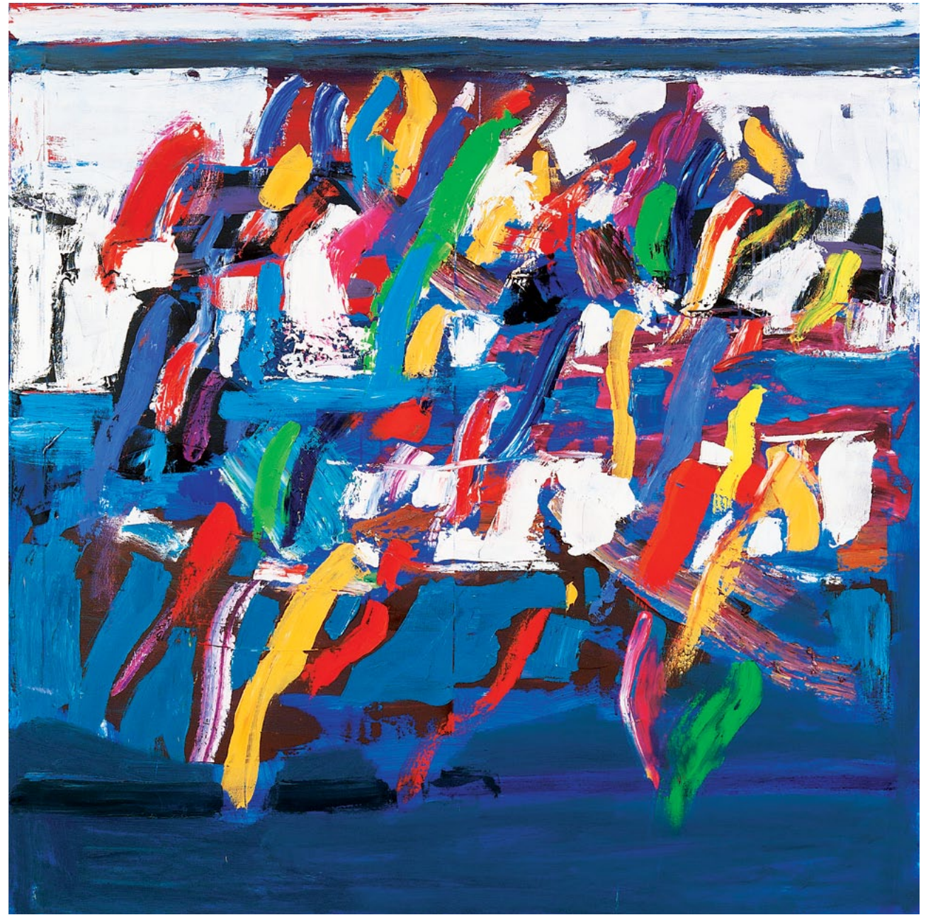
150x150 см. Полотно, олія 150x150 cm. Oil on canvas