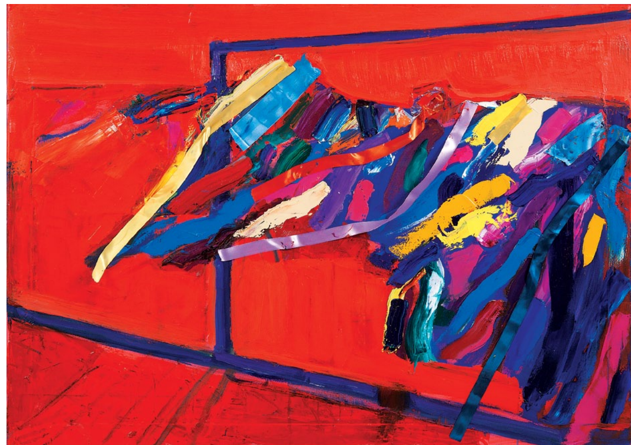
100x140 см. Полотно, олія 100x140 cm. Oil on canvas