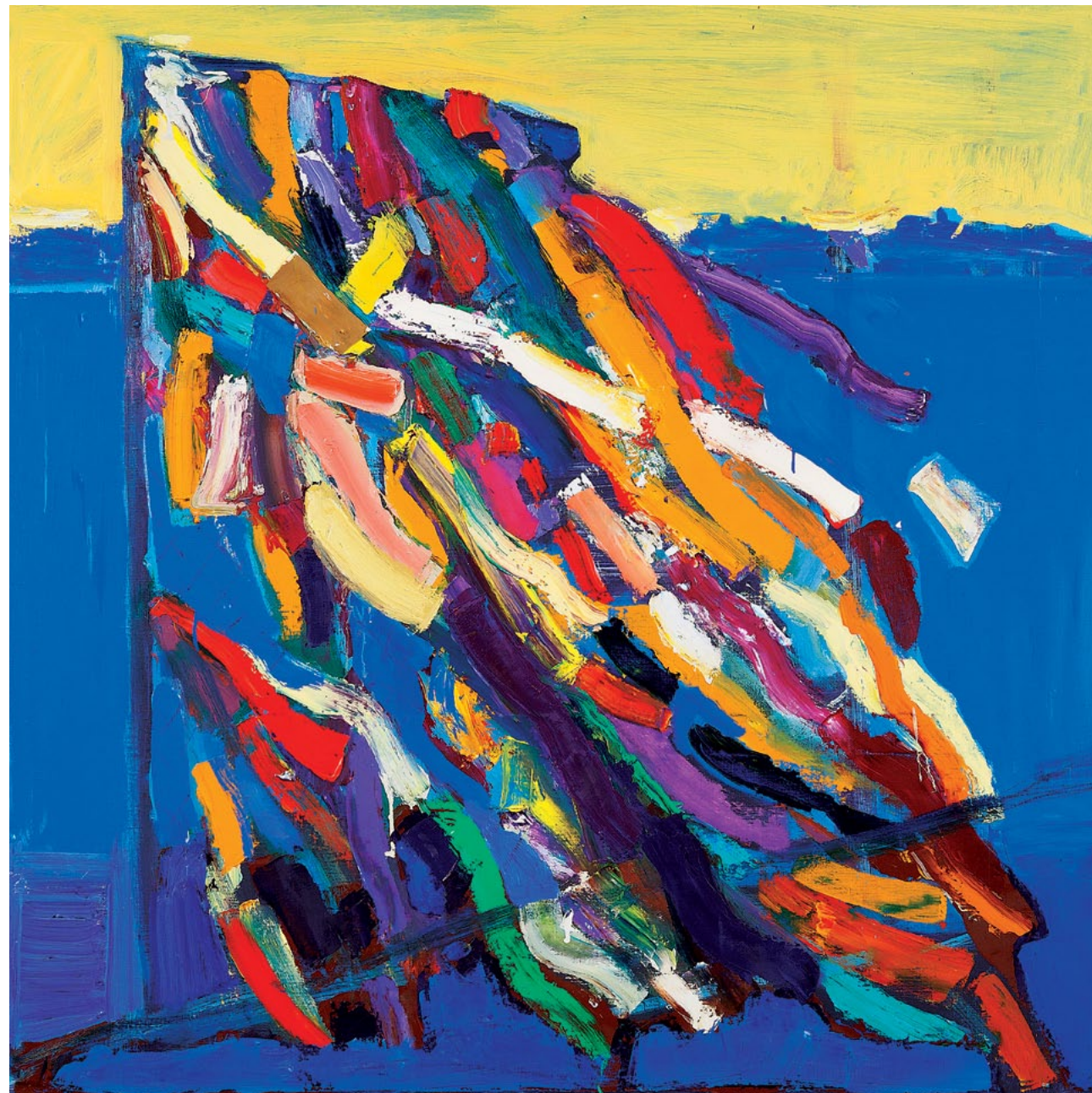
150x150 см. Полотно, олія 150x150 cm. Oil on canvas