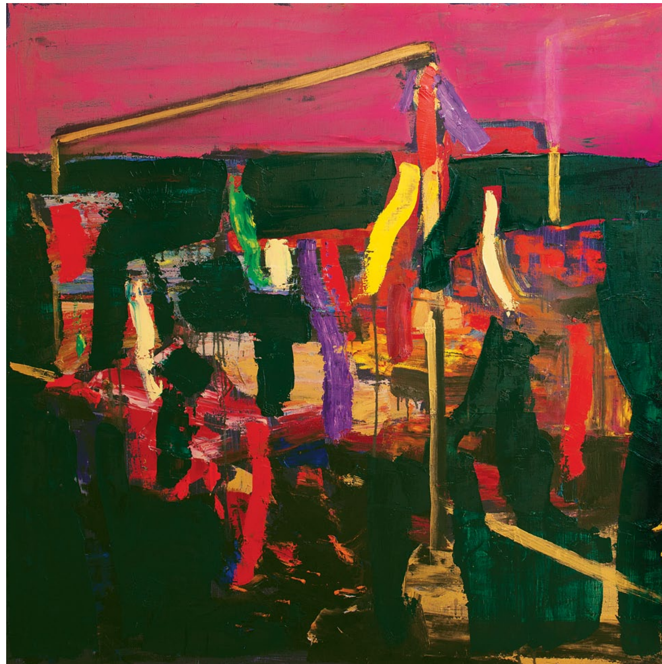
150x150 см. Полотно, олія 150x150 cm. Oil on canvas